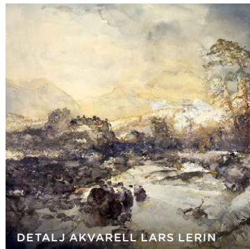
DETALJ AKVARELL LARS LERIN